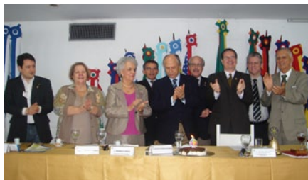
Aniversariantes do mês junto com outros companheiros, cantando o "Parabéns para Você".

Na sequência, houve o tradicional corte do bolo.